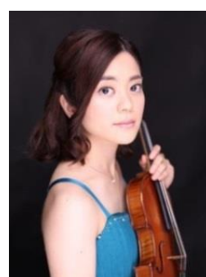
藁科杏梨 ヴァイオリン